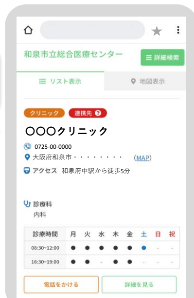
登録医検索システムへの掲載