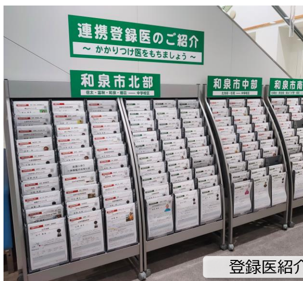
登録医紹介カード